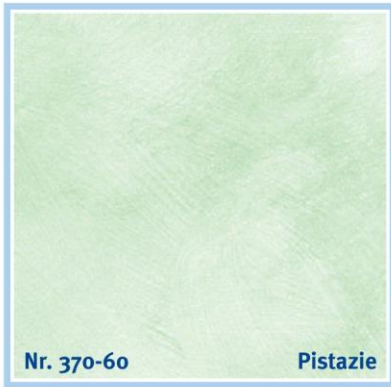
Nr. 370-60 Pistazie

sky blue | bleu ciel | hemelsblauw | celeste | azul cielo | γαλάζιο