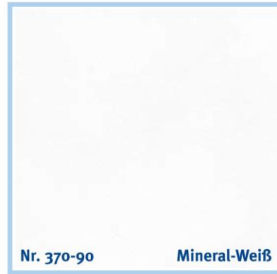
Nr. 370-90 Mineral-Weiß

pistachio | pistache | pistachegroen | pistacchio | pistacho | φιστικί