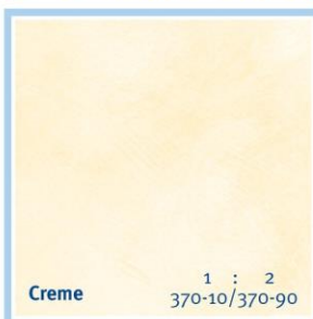
Creme 1 : 2 370-10/370-90