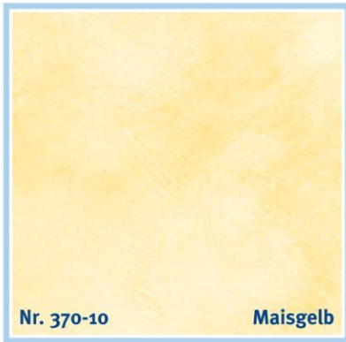
Nr. 370-10 Maisgelb

maize yellow | jaune mais | maïsgeel | giallo mais | amarillo maíz | κίτρινο καλαμποκιού