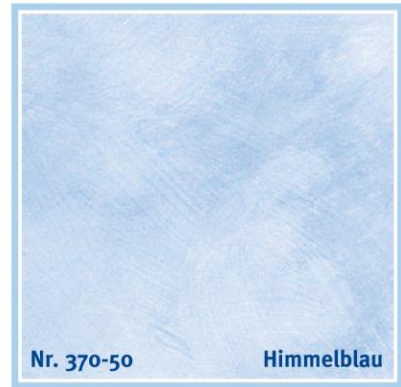
Nr. 370-50 Himmelblau

coral | corail | koraalrood | corallo | coral | κοράλι