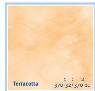
Terracotta 1 : 2 370-32/370-10

Mischungsverhältnis der abgebildeten Farbtöne: 3 Teile Wasser, 1 Teil Farbe | Mixing ratio for the reproduced colour tones: 1 part of paint in 3 parts of water. | Ratio de mélange pour les tons représentés: 3 parts d'eau, 1 part de lasure/cire. | Mengverhouding afgebeelde kleuren: 3 delen water, 1 deel kleur | Rapporto di miscela dei colori riportati: 1 parte di colore, 3 parti di acqua | Proporción de mezcla por los tonos de color reproducidos: 1 parte de color en 3 partes de agua. | Αναλογίες ανάμιξης των απεικονιζόμενων αποχρώσεων: 1 μέρος χρώμα, 3 μέρη νερό.