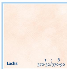
Lachs 1 : 8 370-32/370-90