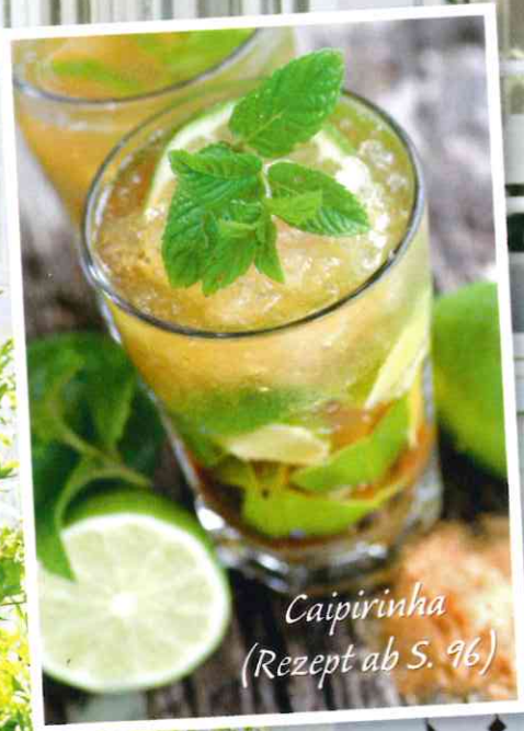
Caipirinha (Rezept ab S. 96)

Wohnen im Grünen Der Wintergarten ist zu jeder Jahreszeit die Verbindung zwischen drinnen und draußen. An schönen Tagen stehen Türen und Fenster offen, die Bank vor dem Haus wird zur Sommerresidenz