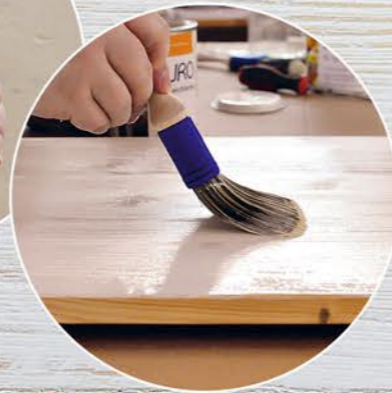
2. Mit der Lasur oder Farbe der Wahl streichen, ggf. mehrfach. Gut trocknen lassen.