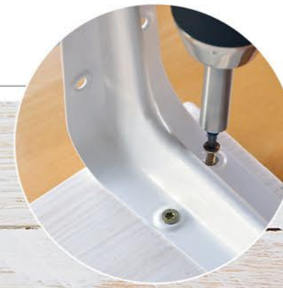
3. Die Regalhalterung anbringen.