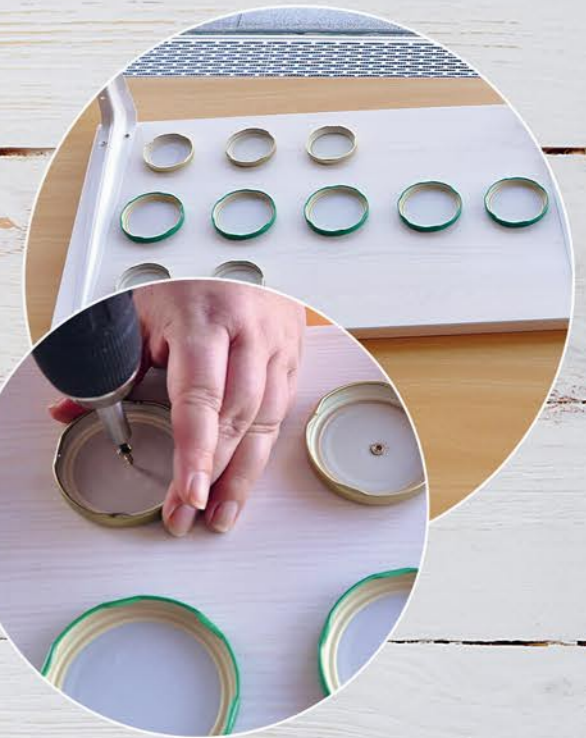
4. Die Deckel der Gläser gleichmäßig auf dem Brett anordnen und anschrauben. Bei sehr stabilen Deckeln ggf. vorher den Deckel punktieren.